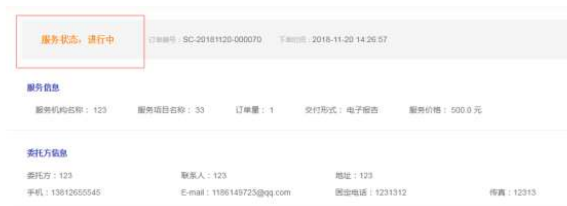
图 2-9 订单进行中

机构开始服务后，用户可查看订单的服务状态已变为进行中（图 2-9 所示），此时买家只需要等待机构服务完成。