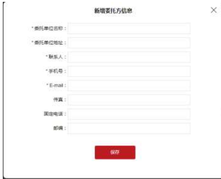
图 2-6 新增委托方信息