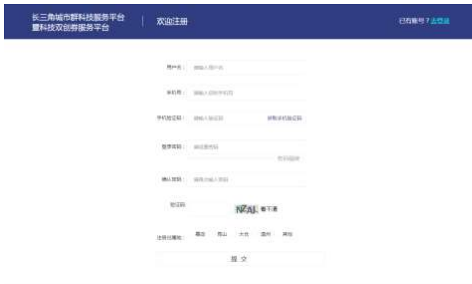
图 1-2 注册界面