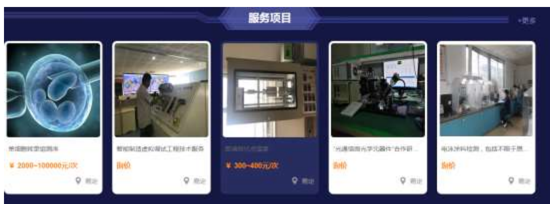
图 2-1 服务项目搜索页面

用户点击检测项目、技术服务、大型仪器任一项进入该类商品搜索页面（图 2-1 所示），点击指定服务项目，进入服务订购界面（图 2-2 所示）。