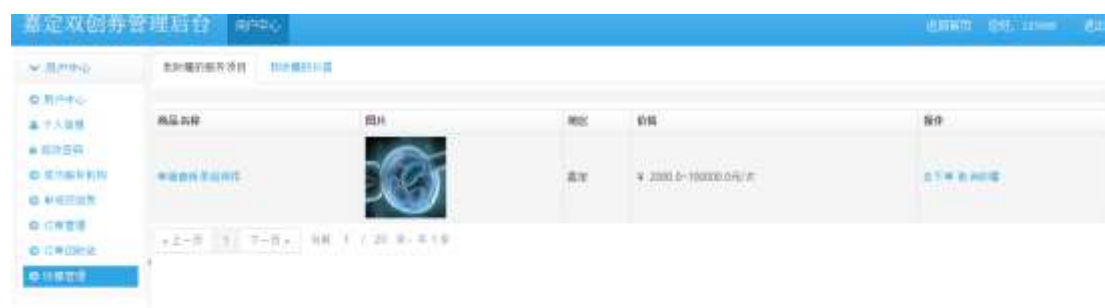
图 2-4 收藏管理界面