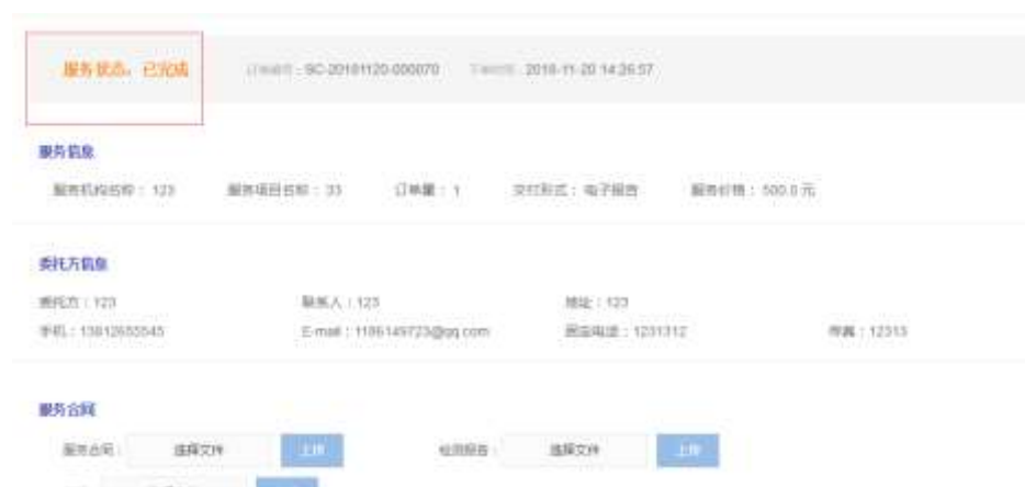
图 2-10 订单状态变为已完成

机构服务完毕后，用户只需要到订单中心查看订单，则订单服务状态变为已完成（图 2-10 所示）。