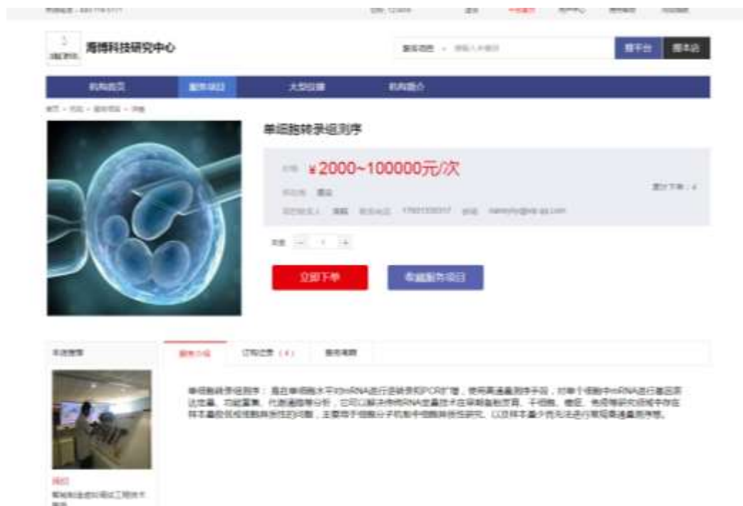
图 2-2 服务项目页面