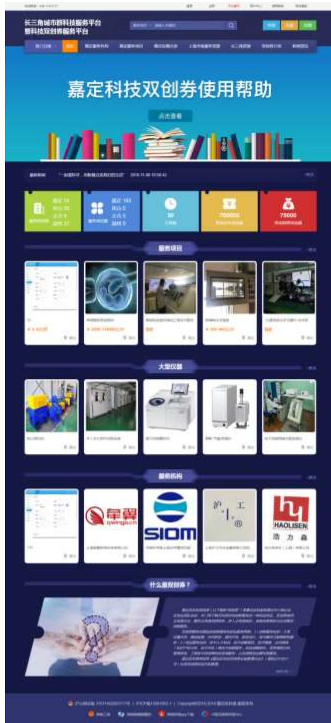
图 1-1 首页

输入网址 http://scq.jiading.gov.cn/homePage/homeskip ，进入该系统（图 1-1 所示）。点击右上角注册可进入注册界面，根据要求填写注册信息（图 1-2 所示）