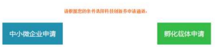
图 3-2 选择申请通道