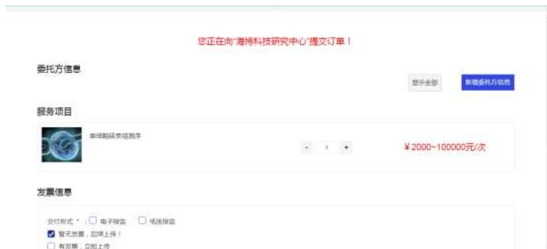
图 2-5 下单界面

进入下单界面后，点击新增委托方信息（图 2-6 所示）用户按要求正确填写完之后，选择交付形式，点击确认下单，系统会弹出确认提示框（图 2-7 所示），点击确认即下单成功（图 2-8 所示）。用户可点击右上角“用户中心”，选择订单管理查看。