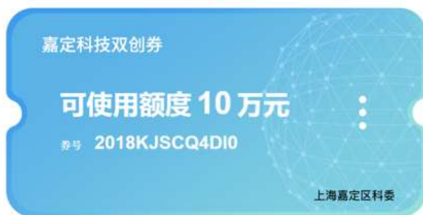
图 3-6 审核通过界面