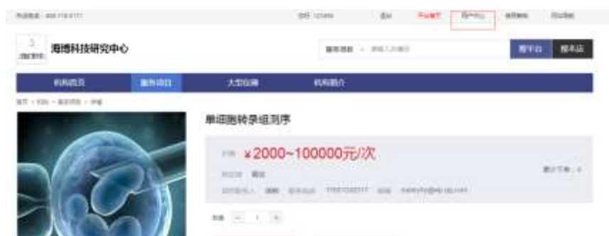
图 2-3 用户中心

点击收藏服务项目，系统会弹出收藏成功窗口，点击确定，服务项目就被添加收藏管理中。点击用户右上角用户中心（图 2-3 所示）可看到收藏管理（图 2-4 所示），点击去下单即跳转到下单界面（图 2-5 所示）。